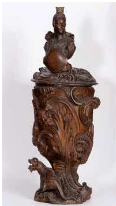
Obr. 9. Vyrovaná stojatka na theriak č. 2