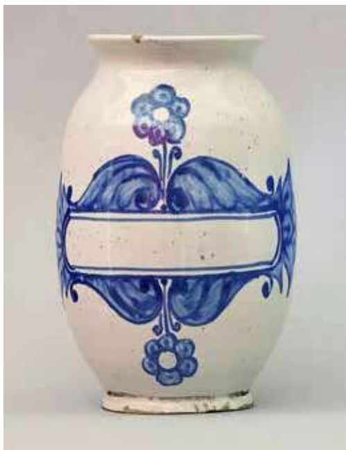
Obr. 6. Válcová stojatka