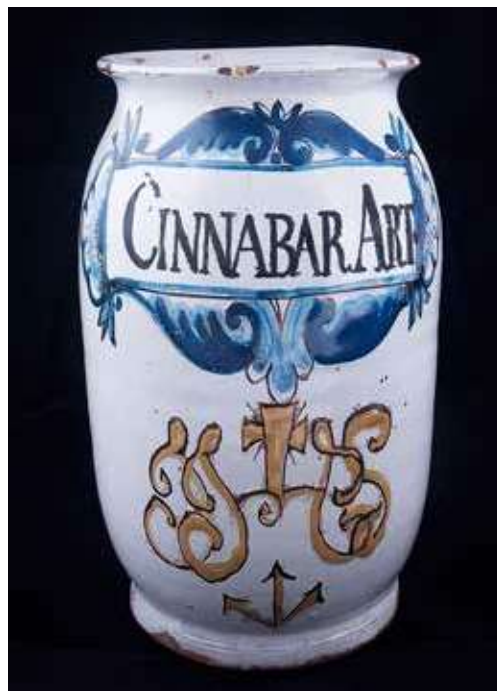
Obr. 8. Válcová stojatka s motivem IHS a nápisem „Cinnabar Art“

(obr. 8) odkazující na rumělkou, lat. cinnabaris , užívanou jako červené barvivo. V inventáři byla v době uzavření lékárny zaznamenána v množství 2½ lb. a ¼ lb. v ceně 6 zl. 15 kr. a 38 kr. Tento typ nádob se obvykle užíval na masti, lektvary apod., které se uzavíraly kůží převázanou pod vystouplým okrajem 30 ). Obě nádoby odpovídají středoevropské tvorbě od konce 17. století 31 ), která se udržuje i v polovině a ve druhé polovině 18. století. Srovnat ji lze s nizozemskou produkcí konce 17. a první poloviny 18. století, běžně se vyskytovaly i nádoby německého 32 ) či italského původu 33 ). Stojatky nepochybně českého či slovenského původu mají však svůj vlastní charakter spjatý pravděpodobně s keramikou habánskou, která