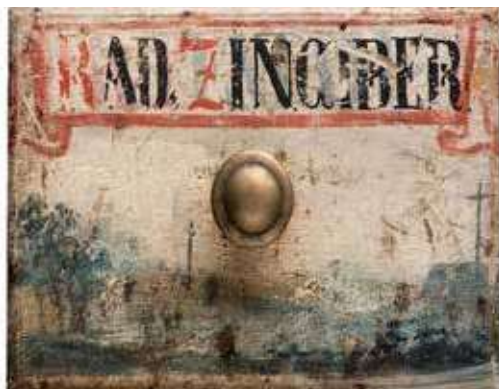
Obr. 3. Lékárenská skříň

K nejcennějším položkám rostlinných léčiv patřily dnes poměrně běžné části rostlin. Pro současného člověka