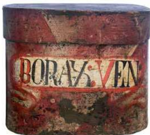
Obr. 15. Zásuvka lékárenské skříně na uchovávání listů seny