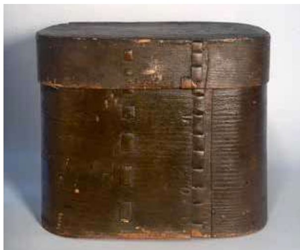
Obr. 13. Dýhová krabice na ukládání listů seny