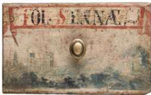
Obr. 14. Dýchová krabice na ukládání listů seny, pohled na zadní stranu