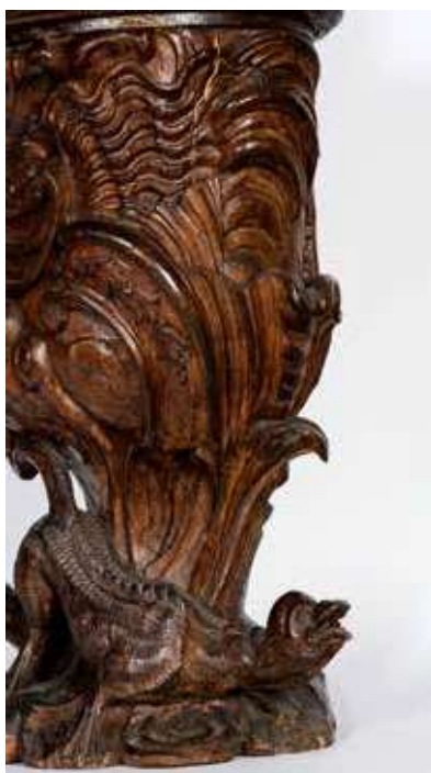
Obr. 11. Detail ještěra a nohy vyřezávané stojatky na theriak č. 1

Dřevěné stojatky reprezentují dvě velké vyřezávané nádoby nepravidelného tvaru. Ojedinělá díla zručného řezbáře sloužila pro uložení farmaceutického prostředku (obr. 9, 10). Noha je u paty zdobena dvěma mýtickými zvířaty s ploutvovitými končetinami, ještěřím tělem a otevřenou tlamou (obr. 11). Obě bytosti jsou situovány za sebou, přičemž první hledí k čelní straně a druhá k zadní části. Kalich tvoří soubor dekorativních motivů z rokaje, listoví a vejcovitých motivů, vrchol je zvýrazněn oblou římsou a završen bustou mladé ženy s rozpuštěnými vlasy, štítkem před hrudníkem a korunou na hlavě. Celkové pojetí je nesmírně dynamické, expresivní a detailně provedené. Druhá nádoba zachovává podobné