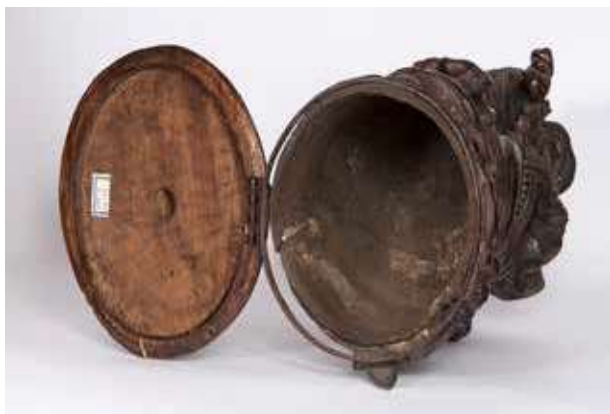
Obr. 10. Vyřezávaná stojatka na theriak č. 1, pohled na otevřenou nádobu a víko upevněné na obruči s pantem

renské praxi již od renesance 37) a sloužil pro uchování olejů nebo sirupů. Z hlediska stáří se pravděpodobně jedná o mladší kus z produkce některé lidové dílny.