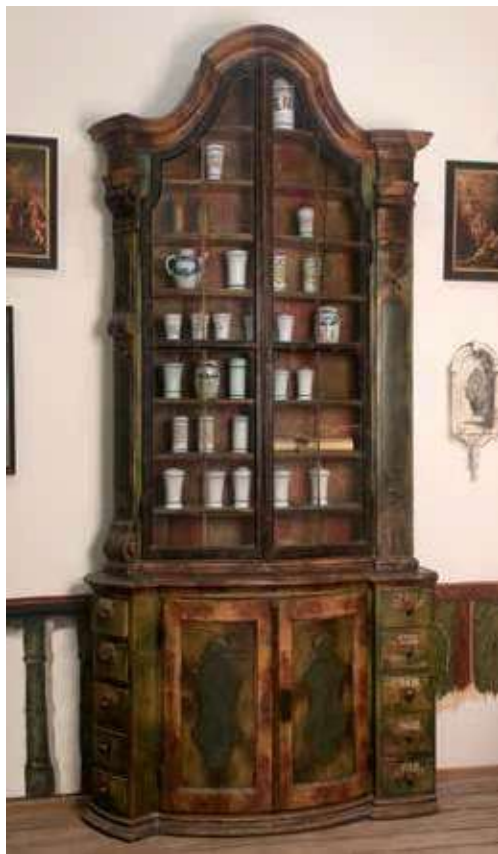
Obr. 4. Čelo zásuvky z lékárenské skříně pro uložení zásuvu

může být překvapující výběr ze dvou druhů léčivých aloe, z nichž byla dražší Aloe vera , Aloe succotrina (v inventáři (dále jen zkratka inv.) Aloe succotr. , 1¼ lb. (libra) za 1 zl. 45 kr.), užívaná již ve středověku jako prudké projímadlo 14 ). Proti kolice a bolesti 15 ) se využívaly dnes málo časté bobule vavřínu, baccae lauri (inv. baccar. laur. , 28 kr. za 3½ lb.). Dále u nejvíce ceněných položek najdeme zastoupení hřebíčku – Eugenia caryophyllata (inv. caryophil. , 1¼ lb. za 6 zl.), oblíbeného koření užívaného rovněž pro znecitlivění v rámci zubního lékařství. V inventáři jsou některá simplicia psána pohromadě dle typu nebo části rostliny (např. kůry, kořeny apod.), další jsou pak samostatně seřazeny dle abecedního pořádku. Ze skupiny kůr byla důležitým jezuitským artiklem především chinovníková kůra – cortex chinae (inv. cort. chinae ), dovážená z Nového světa. V Telči se množství 4 lb. cenilo na 6 zl. 48 kr. K prodeji byla dále kůra granátového jablka, cortex (inv. cort. Granati , ½ lb. za 8 kr.), guajaku léčivého – guaiacum officinale (inv. guajac , 3 lb. za 30 kr.) z Jižní Ameriky s účinky na kožní choroby a údajně i syfilis 16 ) a kašti (inv. sassafras , ½ lb. za 24 kr.). Kůra se využívala i ze stromů mandlovníků (inv. myrabol. , ½ lb. za 4 zl. 12 kr.), odebíraná až z pěti jeho druhů.