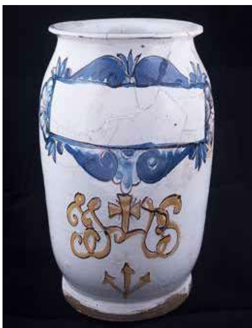
Obr. 7. Válcová stojatka s motivem IHS

proudy evropské tvorby reflektovala. Obdobný styl s folkloristickými prvky v modré barvě kolem bílého nápisového rámce nalezneme ve sbírce hospitalu Kuks, tamější nádoba vzešla z dílny habánských mistrů 34 ) a pochází z konce 17. století 35 ). Rovněž u telčských kusů je možné předpokládat dle dohledaných analogií jejich výrobu již v 17. století 36 ). Poslední keramická stojatka připomíná svým tvarem džbánek s útlým válcovým hrdlem a uchem. Přední část opět zdobí modrý rám lidového charakteru. Tvar nádoby je ve střední Evropě běžně užíván v léká-